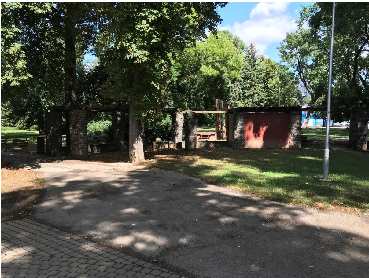
Foto 7: Drobné stavebné objekty budú odstránené. Napríklad šopa s pozostatkom pergoly a pódium.