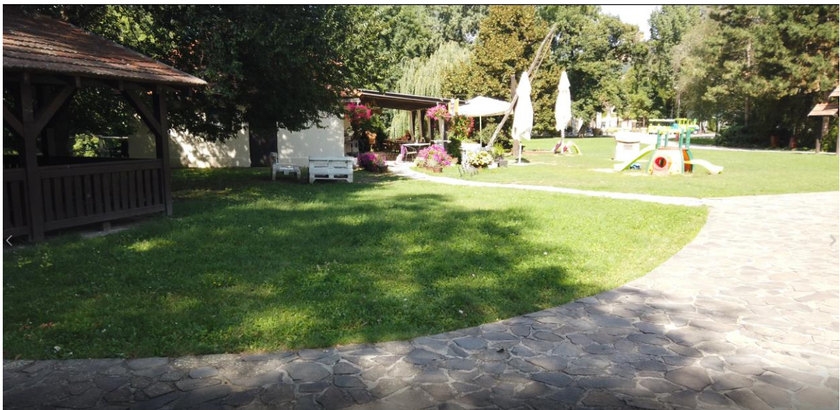
Foto 18: Kaviareň. Navrhujeme vytvorenie reprezentatívneho predpriestoru kaviarne s rastrom stromov. V jeho blízkosti je navrhnutá 2. herná zóna pre najmenšie deti a vodné hry.