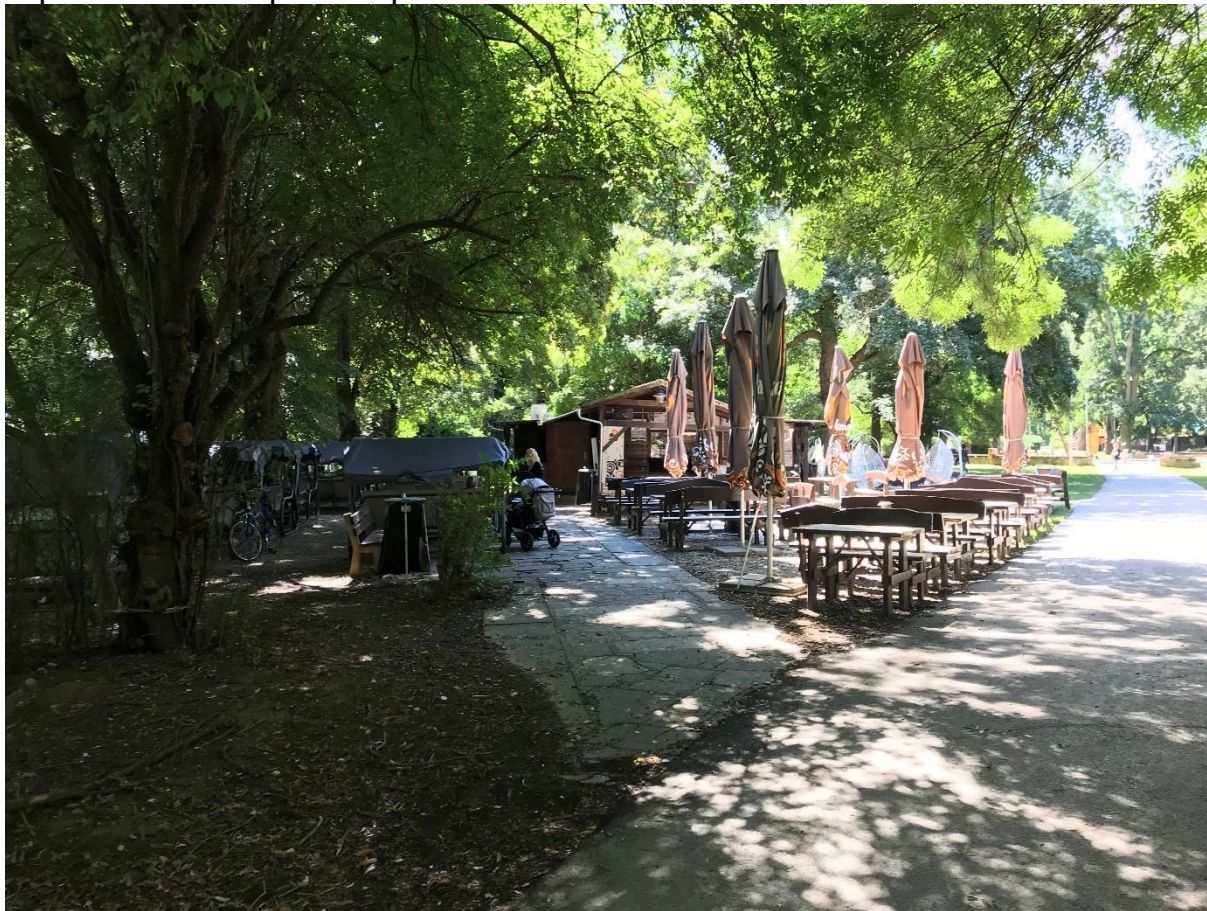
Foto 8: Existujúce občerstvenie formou kiosku s rôznorodým mobiliárom.

Navrhujeme odstránenie existujúceho kiosku, spevnených plôch a mobiliáru. V priestore je umiestnený nový kiosk, ktorý bude ladiť s architektúrou nových malých stavebných objektov celého parku.