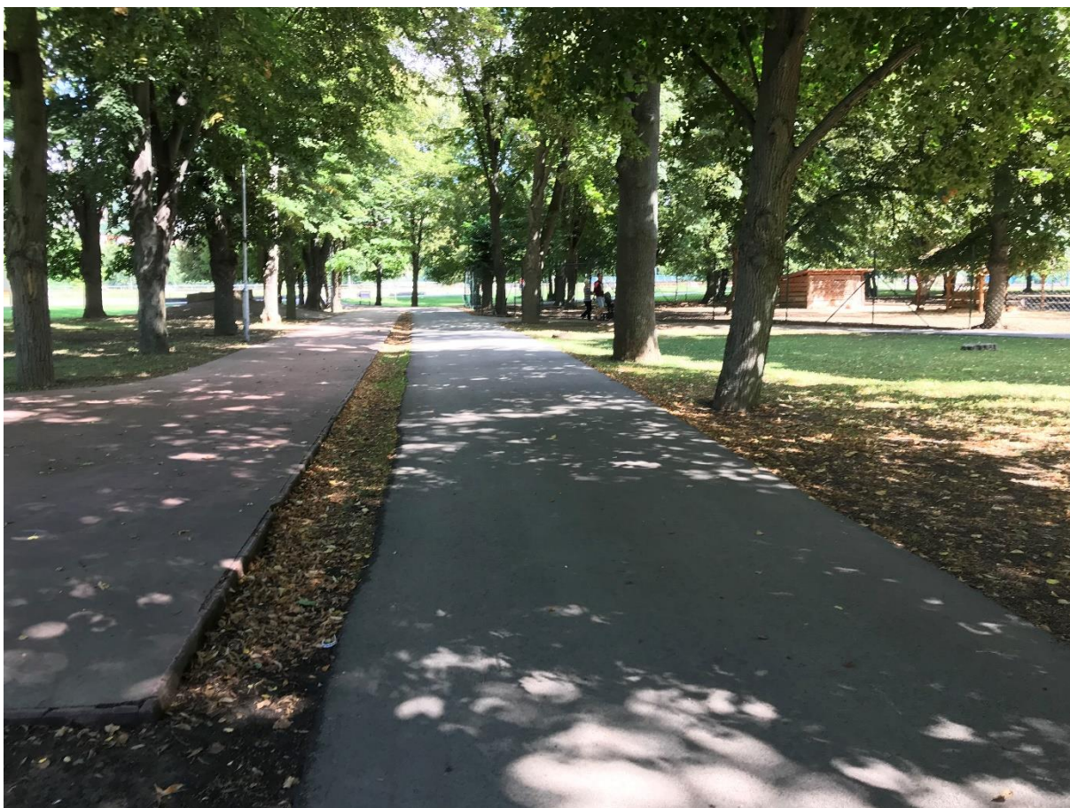
Foto 10: Existujúca inline trasa a asfaltová cesta zostane zachovaná.