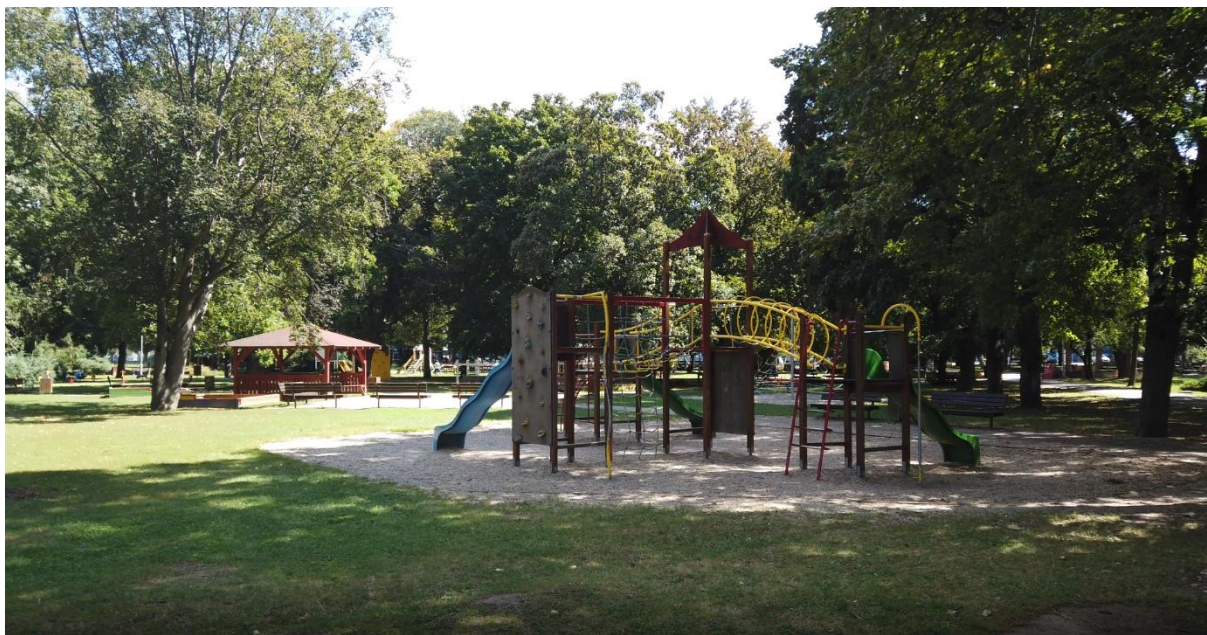
Foto 9: V parku sa nachádza veľké množstvo detských herných prvkov rôzneho dizajnového výrazu s rôznym materiálovým spracovaním dopadových plôch bez konceptu rozmiestnenia. Navrhujeme vytvorenie 2 veľkých herných zón (pozri etapa 3 a 4), do ktorých budú rozmiestnené herné prvky pre rôzne vekové kategórie detí a fitness prvky. Značná časť prvkov bude inkluzívnych.

Navrhujeme odstránenie existujúceho kiosku, spevnených plôch a mobiliáru. V priestore je umiestnený nový kiosk, ktorý bude ladiť s architektúrou nových malých stavebných objektov celého parku.