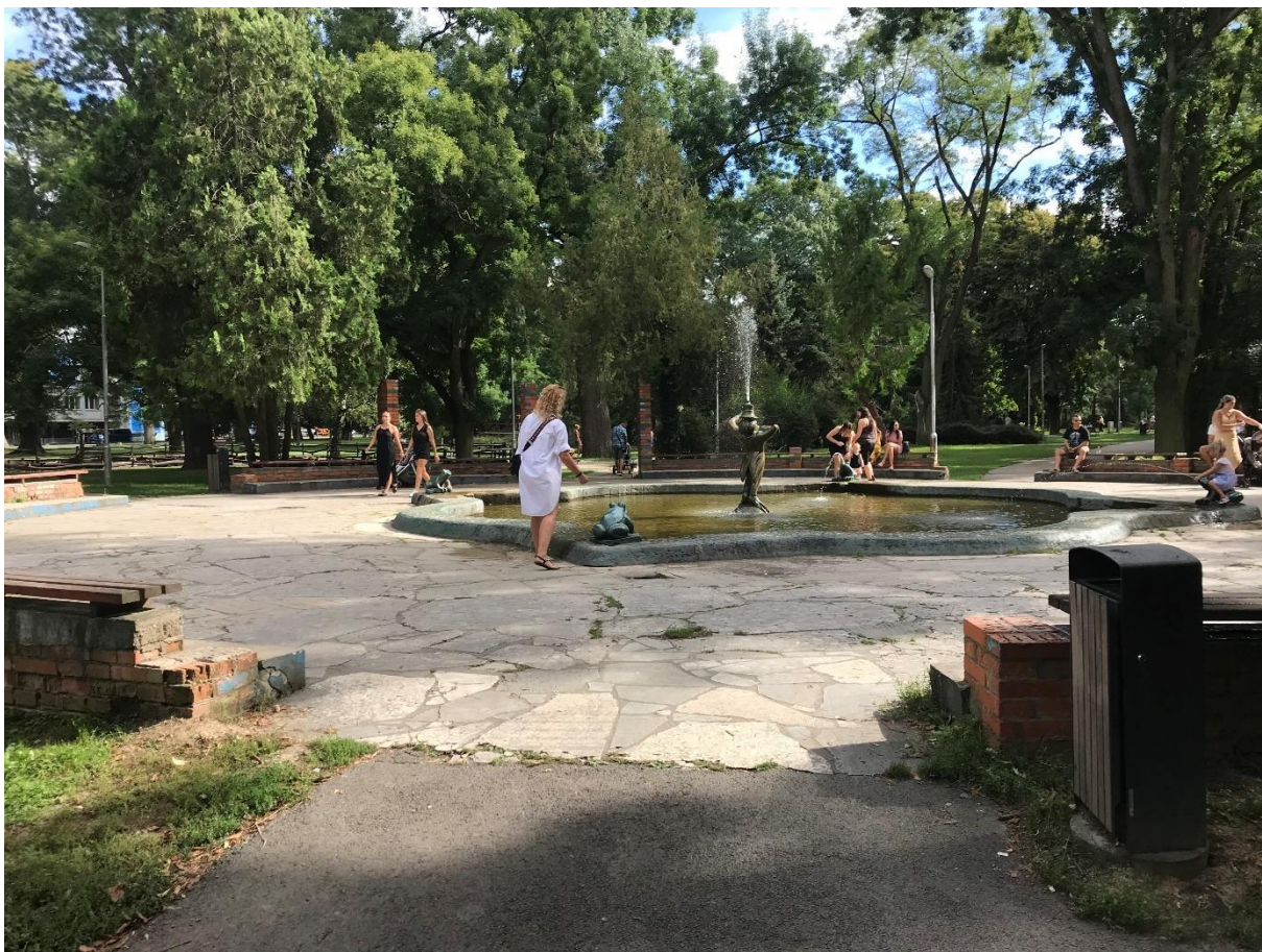
Foto 1: Žabia fontána s príslušným kruhovým priestorom je výrazným prvkom parku a obľúbeným miestom pre oddych a relaxáciu. Tvorí príjemnú mikroklimu miesta so zvukovou kulisou vodných strekov. Celý kruhový priestor je však v zlom technickom stave a nevyhovuje požiadavkám pre park 21. storočia. Navrhujeme nové materiálové riešenie priestorov, ktoré však bude rešpektovať súčasnú pôdorysnú danosť.