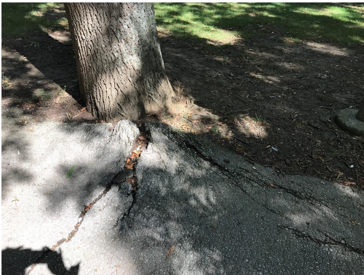
Foto 4: Poškodenie asfaltu koreňovým systémom stromu. Odstránenie spevnených povrchov z koreňových systému musí byť prevádzané s veľkou šetrnosťou a dôrazom na zdravie jedinca.